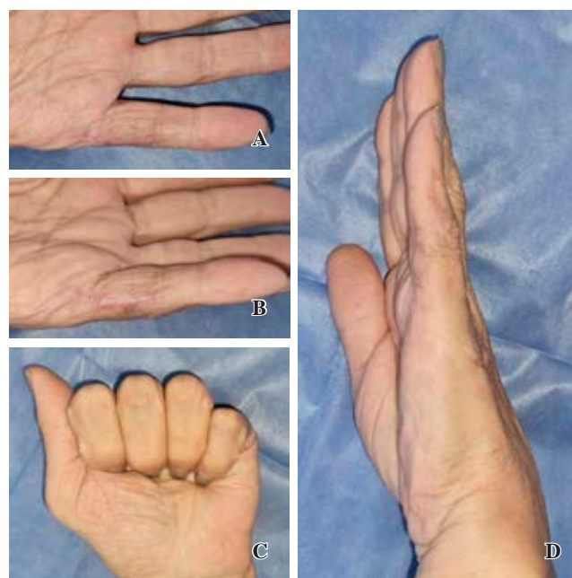
Figura 4: Postoperatorio un año. A y B) Cicatriz. C y D) Rango de movilidad articular en flexión y extensión.

La ecografía Doppler es un método no invasivo que permite visualizar el flujo bidireccional de sangre a través del