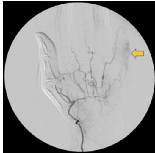
Figura 2: Angiografía. Vascularización de arco palmar y arteria colateral digital radial de muñeca normal. Flecha: alteración en arteria colateral digital cubital de muñeca.

Dentro de las etiologías prevalentes, las lesiones penetrantes suelen ser la razón más frecuente de los pseu-