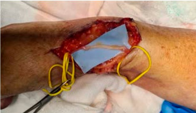
Figura 3: Reconstrucción de neuroma con autoinjerto de nervio sural, sutura término-terminal.

sural para reconstruir el nervio lesionado. Se realizó abordaje abierto para exposición de nervio sural mediante incisión de 15 cm en borde posterolateral de pierna derecha, tomando como referencia anatómica una línea imaginaria entre tendón calcáneo y maléolo lateral. Se expuso nervio sural, se tomó injerto de nervio sural de 4 cm y los muñones remanentes se enterraron en tejido muscular adyacente.