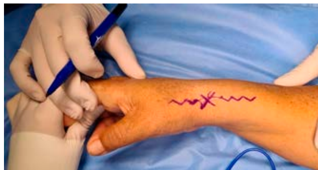
Figura 1: Marcaje con «X» de sitio doloroso y abordaje amplio en zigzag.

En sala de operaciones, previo a la inducción anestésica, se marcó el sitio con mayor dolor y se planificó abordaje amplio en zigzag ( Figura 1 ). Posterior a la exploración, se encontró con un neuroma en continuidad de la rama lateral del nervio radial superficial ( Figura 2 ). Se retiró el neuroma con bisturí hasta encontrar fascículos de apariencia sana. Se midió la brecha entre los cabos y se encontró brecha de aproximadamente 3 cm. Se decidió tomar injerto de nervio