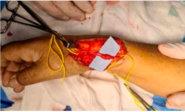
Figura 2: Neuroma de la rama lateral del nervio radial superficial.