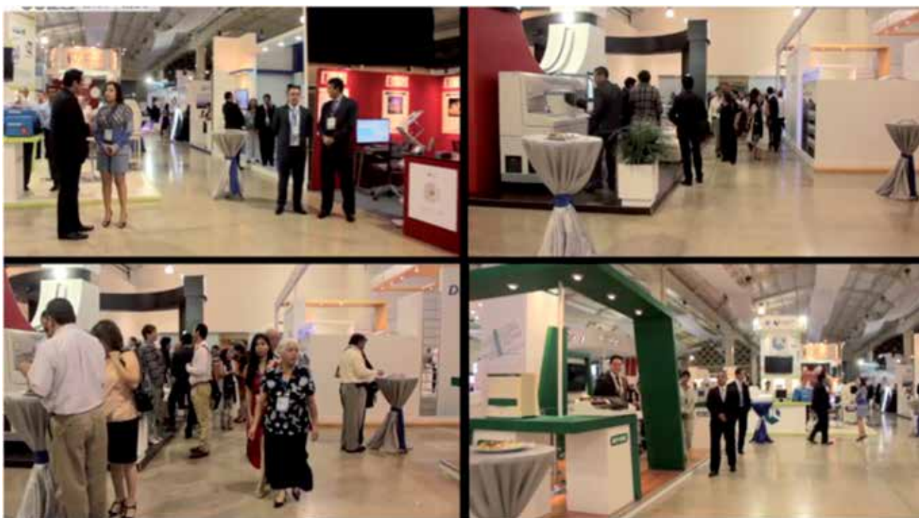
Figura 5. Exposición tecnológica.