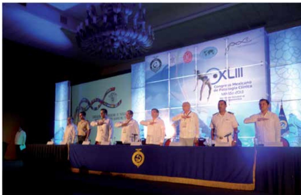
Figura 6. Inauguración del XLIII Congreso Mexicano de Patología Clínica 2013, Mérida, Yucatán.