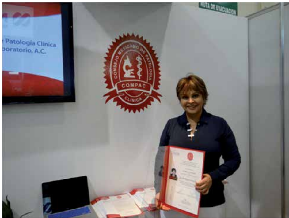
Figura 7. Entrega de Recertificados a Patólogos Clínicos, por el Consejo Mexicano de Patología Clínica.