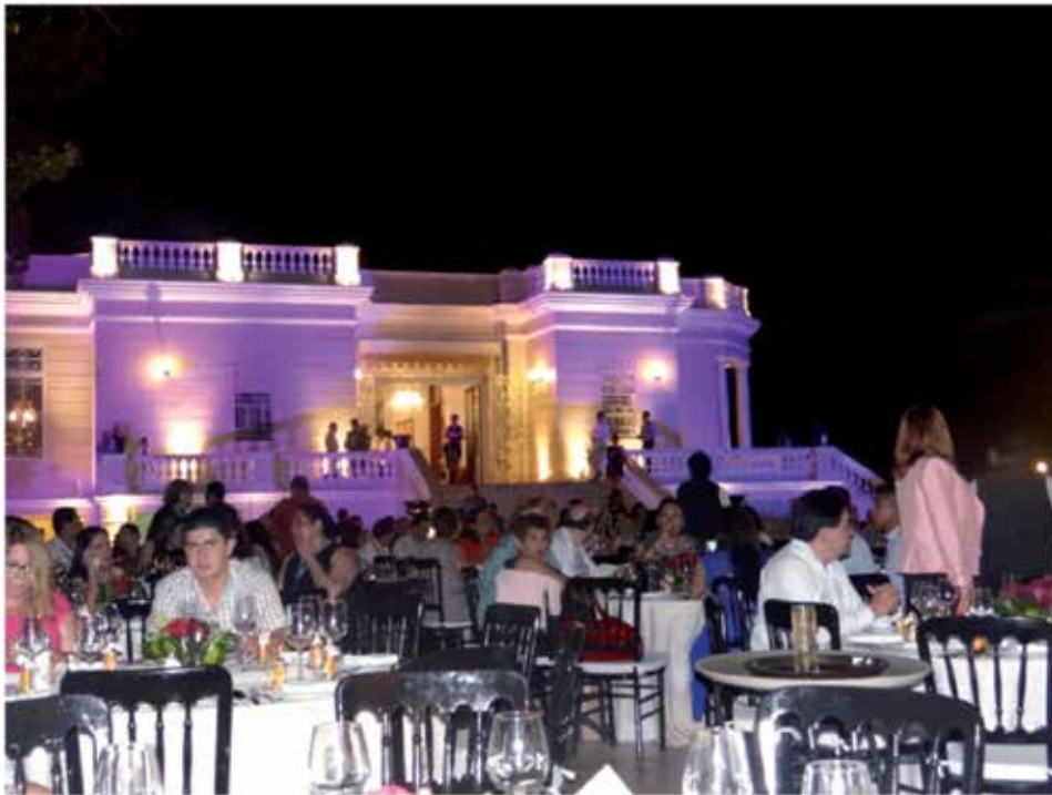
Figura 8. Cena de Gala del Congreso.