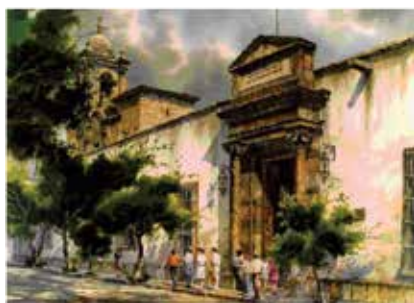
Figura 2. Entrada al Hospital Civil de Guadalajara "Fray Antonio Alcalde" Joaquín Camacho.