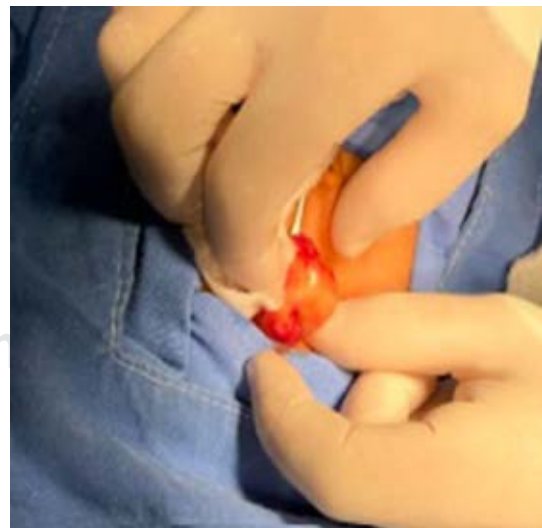
Figura 4: Gemela 1: se observa píloro hipertrófico 3 × 2 cm.

En el presente artículo se describen dos gemelas monocigóticas que desarrollaron EHP, lo cual resulta interesante, dado que existen pocos reportes similares en México. 1 Krogh y colaboradores en 2010 estudiaron 738 niños en Dinamarca, donde estimaron que el porcentaje de heredabilidad es de 87%, encontrando una relación de presentación en hombres y mujeres de 4:1 así como un riesgo seis veces mayor en los gemelos monocigóticos (afectación de 46%) y en gemelos dicigóticos con afectación de 7.7%; 4 en México no se tienen datos estadísticos similares. Por su parte, Darlene en 2018 afirmó que, cuando un gemelo tiene EHP, alrededor de 80-90% de las veces el otro gemelo también lo