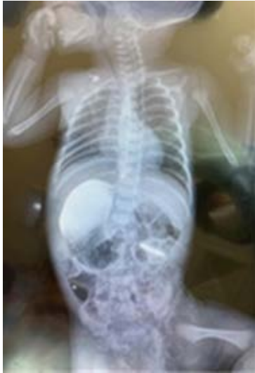
Figura 3: Unión esofagogástrica a la derecha, estómago retrohepático con curvatura mayor a la derecha, se pintan cardias, fundus y cuerpo, sin observarse adecuada tinción de antro y píloro, igual que sin seguimiento a tubo digestivo alto.