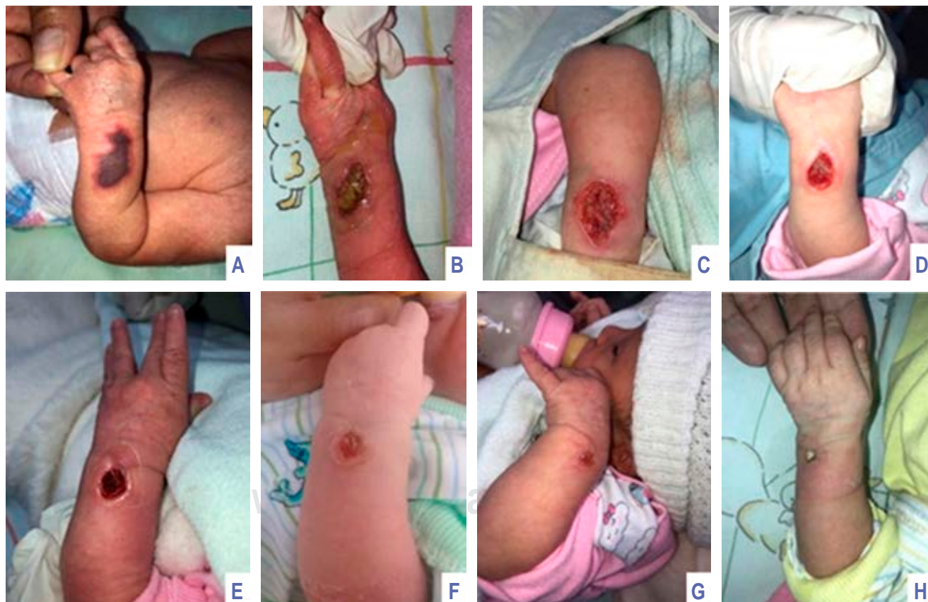
Figura 3: Recién nacido femenino a término. Cronología de fotografías de evolución de lesión por extravasación de gluconato de calcio al 10%.

En los tres pacientes que presentamos, inicialmente se utilizó un parche hidrocólicoide, a fin de promover la delimitación del área necrótica. Ya con la lesión delimitada, durante el desbridamiento quirúrgico se evitó lesionar los tejidos viables. Tras la cirugía se aplicaron apósitos de hidrofibra con plata, los cuales restringen el exceso de humedad, lo que disminuye la