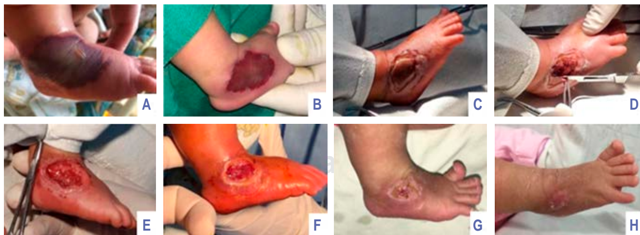
Figura 1: Recién nacido masculino a término. Cronología de fotografías de evolución de lesión por extravasación de gluconato de calcio al 10%.

Dos días después fue valorado por cirugía plástica, donde se observó una lesión redondeada con diámetro de 3.8 cm, de color violáceo y con flictena central que había perdido su contenido líquido ( Figura 1B ). Se realizó flictenólisis, lavado con suero fisiológico y colocación de parche hidrocólico. Cuatro días después apareció delimitación del área de necrosis ( Figura 1C ), por lo que, bajo sedación se realizó escarectomía hasta llegar