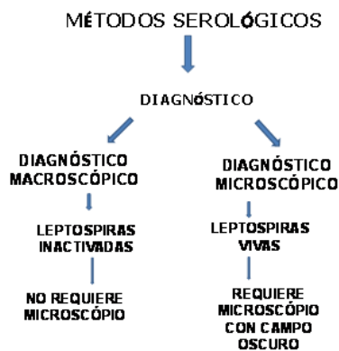
Figura 2. Características diferenciales de los dos métodos c