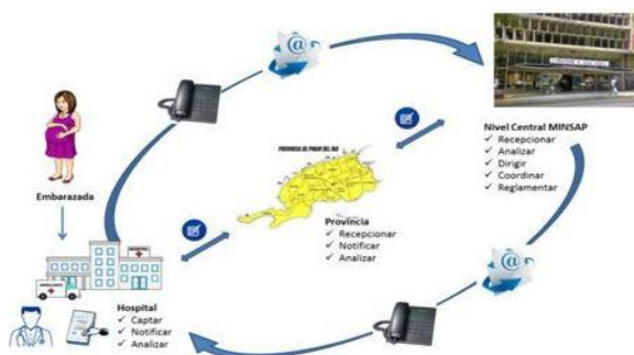
Figura 3. Flujo de datos entre los diferentes niveles

El Departamento Materno Infantil del MINSAP hace un consenso de los datos recibidos de todos los hospitales para conocer la situación a nivel provincial y nacional; para luego obtener estadísticas y realizar análisis que permitan evaluar el sistema y mejorar sus acciones de salud. (Fig. 3)