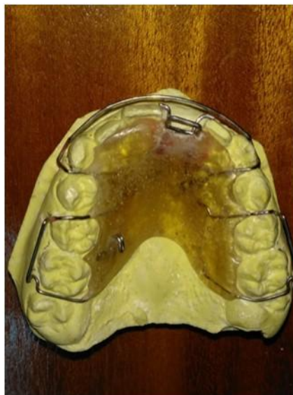
Fig. 2 Aparato tipo Hawley con modificaciones.

Se realizó ingreso en el servicio donde se decidió no utilizar aparatología fija como tradicionalmente ocurre, sino que se diseñó aparato tipo Hawley con modificaciones (guía anterior para cadeneta, resortes de distalización y gancho de tracción contralateral a la zona afectada ubicado a nivel del 1er molar), que permitieron recuperar el espacio perdido y ubicar al diente retenido en el arco a corto plazo, lo que además constituyó un considerable ahorro de recursos a la institución. (Fig. 2)