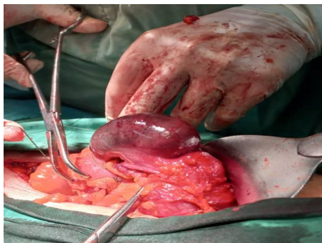
Fig. 1 Cara anterior del ciego isquémica. Hospital Provincial Universitario Clínico-Quirúrgico Dr. Gustavo Aldereguía Lima. Cienfuegos

Durante el proceder convencional se constata cara anterior del ciego isquémica con parches de fibrina (Fig. 1), rama fina de la arteria ileocecal trombosada (Fig. 2 y 3) y apéndice de características normales. Se realiza hemicolectomía derecha (HCD), iliotransversostomía término-lateral en dos planos de sutura y colocación de drenaje en fondo del Douglas y cerca de la iliotransversostomía.