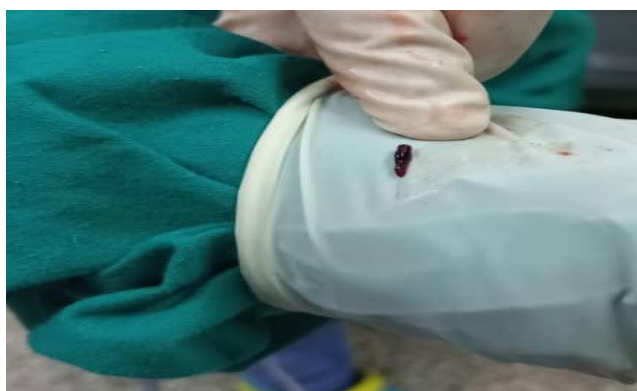
Fig. 3 Trombo extraído

Tras la intervención el paciente se traslada a la Unidad de Cuidado Intensivos Quirúrgicos; se recibe entubado, normotenso, taquicárdico y con diuresis escasa. Mantiene evolución clínica favorable.