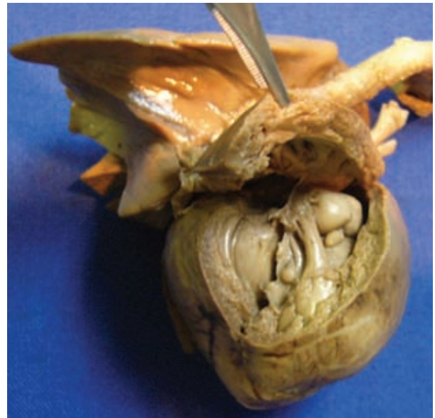
Figura 3. Pieza de necropsia que muestra una tumoración intracardiaca de gran tamaño.

x 2.4 mm, dependiente del tabique interventricular, con obstrucción parcial de la apertura de la válvula tricuspídea y mitral, así como de las vías de salida de ambos ventrículos (figuras 3 y 4).