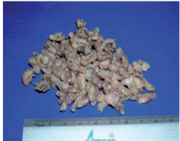
Figura 1. Aspecto macroscópico de tejido prostático resecado con técnica transuretral.

Se recibieron varios fragmentos irregulares de tejido de color café claro y de consistencia regular, que medían en total 8 X 8 X 4 cm. Se incluyó tejido representativo para su estudio histológico (Figura 1).