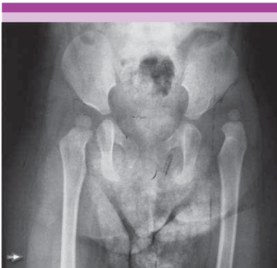
Figura 1. Radiografía anteroposterior simple de pelvis de niña de 14 meses de edad, cadera izquierda con luxación, hipoplasia de cabeza femoral así como de techo acetabular.