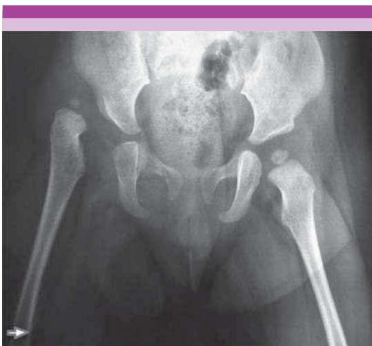
Figura 2. Radiografía anterior simple en ligera abducción de caderas de niña de 12 meses de edad, cadera derecha con luxación así como hipoplasia de cabeza femoral en comparación con la contralateral.

por esto es que su mayor rendimiento se logra cuando es obtenida después de los 2 meses de