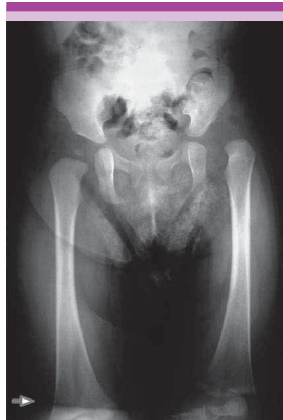
Figura 3. Radiografía anteroposterior de pelvis de niña de 7 meses de edad; cadera izquierda luxada con presencia de hipoplasia de cabeza femoral, la contralateral con leve hipoplasia, además discrepancia en la longitud de las extremidades.

La ultrasonografía de caderas es apropiada en los primeros meses de la vida y es superior a la radiografía de pelvis, ya que permite visualizar la cabeza femoral cartilaginosa y el acetábulo. La forma dinámica de las caderas y su sensibilidad es del 100% para la displasia del desarrollo de cadera. 12,13