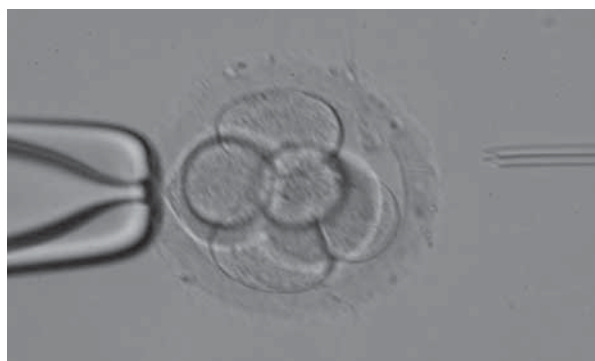
Figura 1. Fijaci3n del embri3n para aplicaci3n del ácido tyrode.

El análisis descriptivo se efectu3 con medidas de tendencia central, con media y desviaci3n estándar, mediana, m3nimos y máximos, seg3n el tipo de distribuci3n de las variables normales o anormales.