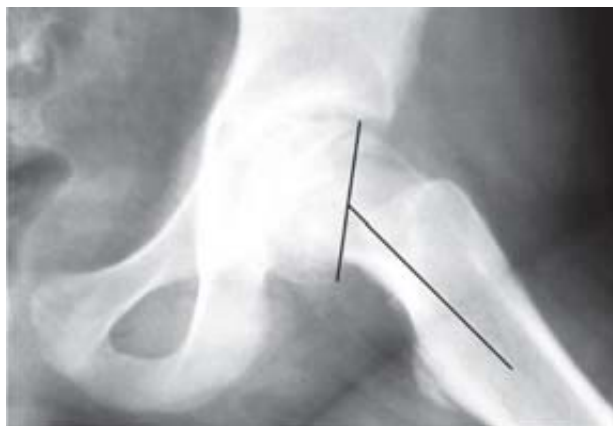
Figura 3. Radiografía lateral de fémur proximal con deslizamiento epifisario. Pérdida de la angulación normal entre la fisis y la diáfisis.