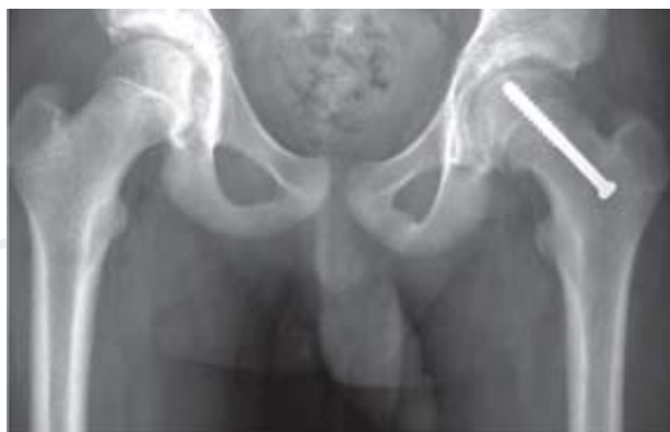
Figura 4. Fijación in situ con tornillo canulado. Nótese la colocación perpendicular a la metáfisis proximal del fémur.