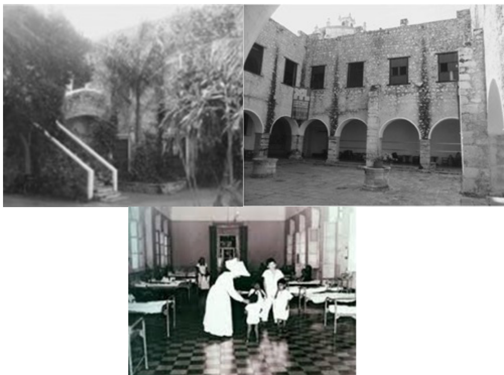
Convento Franciscano de la Mejorada