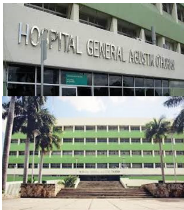
Actual Hospital Dr. Agustín O'Horan y Escudero