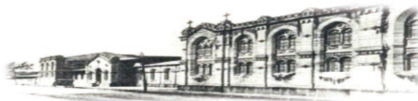
Hospital San Juan de Dios, San José, Costa Rica. Fundado en 1845

(Publicado: noviembre 2015 / ISBN: 978-9930-9521-5-3)