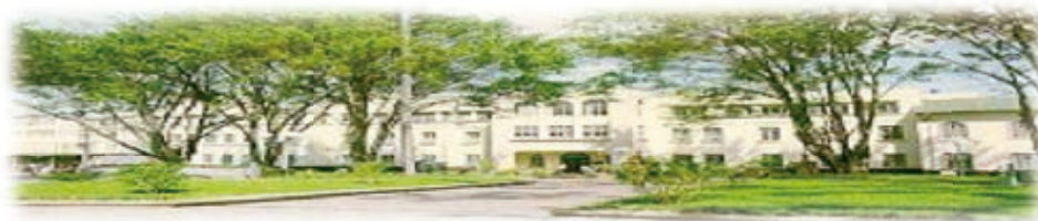
Hospital San Juan de Dios, San José, Costa Rica. Fundado en 1845