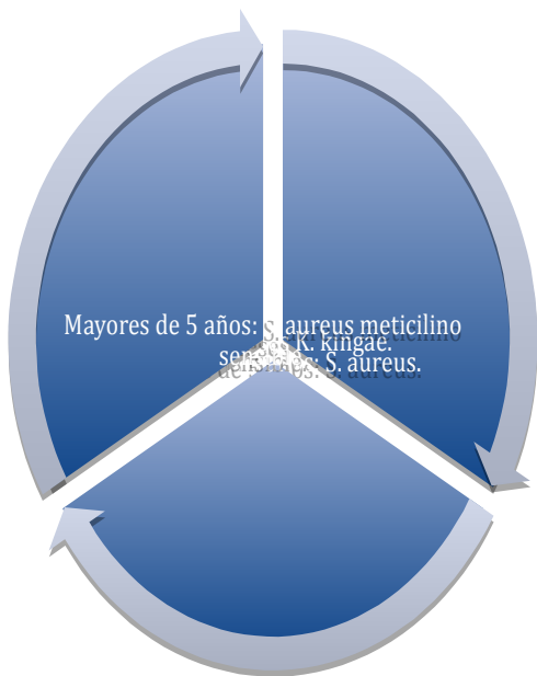
Figura 2. Etiología por grupos de edad