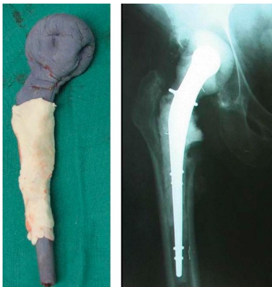
Figura 4. Modelo móvil de espaciador, con radiografía pos operatoria AP

impregnated Cement Spacers for the Management of Prosthetic Joint Infection. J Am Acad Orthop Surg 2009;17: 356-368.