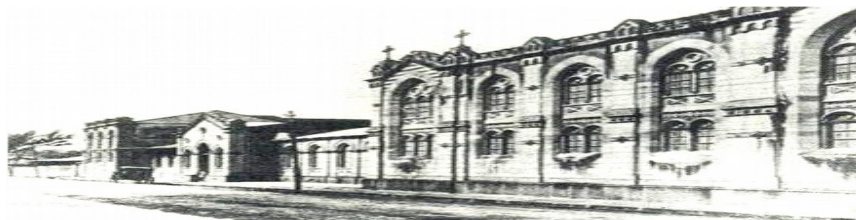
Hospital San Juan de Dios. San José, Costa Rica. Fundado en 1845