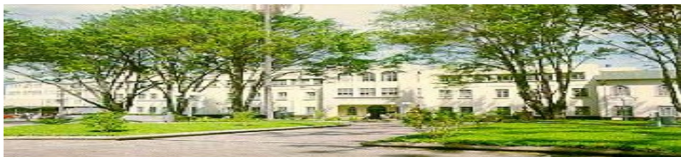
Hospital San Juan de Dios, San José, Costa Rica. Fundado en 1845