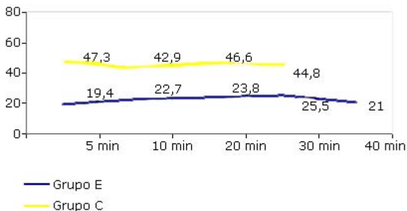
Fig. 1. Comportamiento de la EtCO 2 (mmHg).

La figura 1 muestra el comportamiento transoperatorio de la EtCO 2 . En el grupo E se obtuvieron valores de EtCO 2 entre 14-29 mmHg ( \bar{x} : 21,1 mmHg). En el grupo C se obtuvieron valores de EtCO 2 entre 20-67 mmHg ( \bar{x} : 45,5 mmHg), y en este grupo fue significativa la incidencia de episodios transitorios de hipoventilación, acompañados de sudoración, hipertensión arterial y bradi o taquiarritmias que requirieron tratamiento médico.