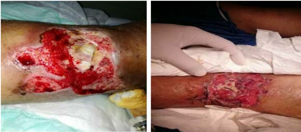
Fig. 3. Evolución de las lesiones de la paciente.

Lo que primariamente fue una fractura cerrada se convirtió en una fractura expuesta secundariamente al proceso séptico ( Fig. 3 ).