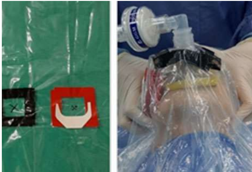
Fig. 1 - Preoxigenación modificada.