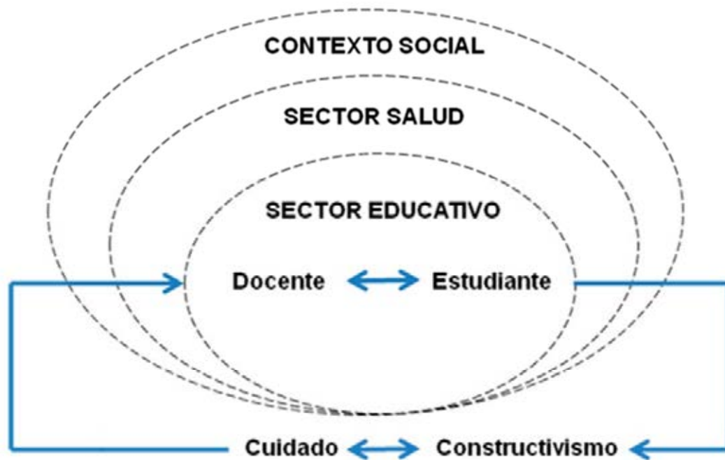
Fig. 1. Esquema del Modelo Innovador de Formación Docente en la Enseñanza Aprendizaje del Cuidado.

Para el cumplimiento de su cometido, la unidad académica ha de estrechar su comunicación y proyectos de intercambio con el sector salud como instancia oficial. Para fines del aprendizaje del cuidado el sector salud es considerado como escenario para la realización de estancias de prácticas donde el estudiante mantiene una interrelación con la persona sujeto de cuidado y con el docente, de quien recibe un acompañamiento pedagógico facilitador que le permite desarrollar un aprendizaje progresivo sobre el cuidado de enfermería. (Fig. 1)