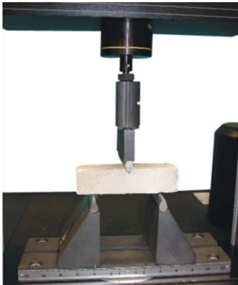
Fig. 2. Cabezal utilizado para los ensayos de flexión.