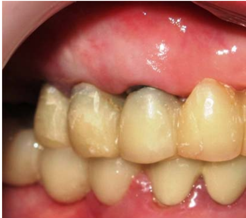
Fig. 2. Primer control. Ocho días después de realizada la cirugía.

Se realiza control ocho días después de la cirugía, se retiran puntos de sutura y existe un proceso de cicatrización dentro de lo esperado sin ninguna complicación y prótesis provisionales debidamente adaptadas (Fig. 2). Transcurridos seis meses existe adaptación de una nueva prótesis provisional. Al ser retirada se percibe leve recidiva de la lesión.