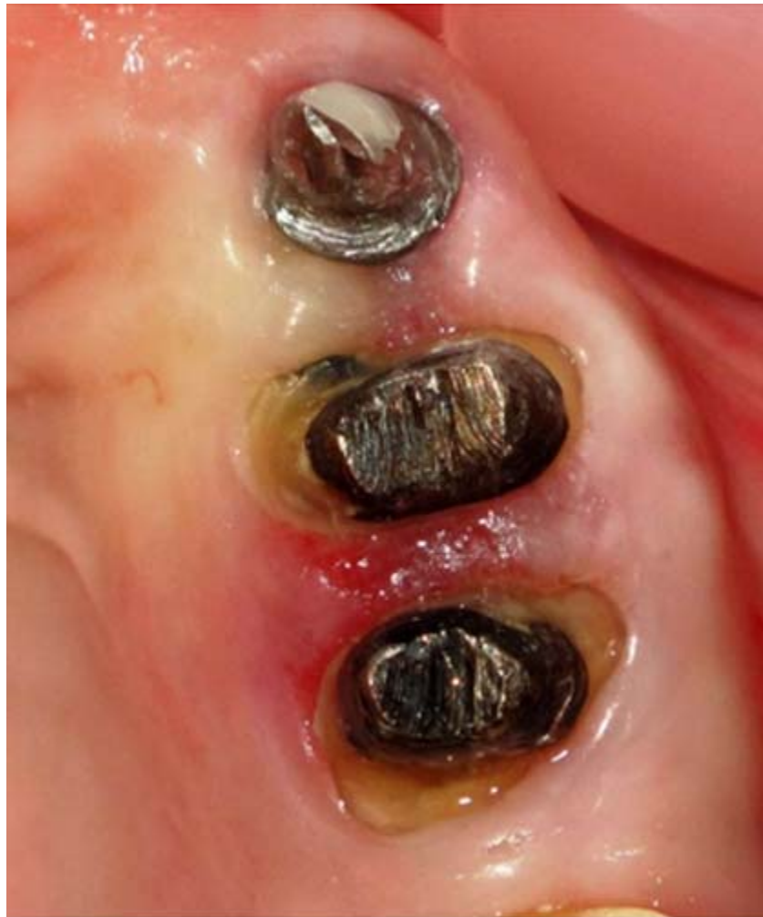
Fig. 1. Vista coronal hemiarcada derecha maxilar superior.

de la lesión. A la palpación se nota que es de consistencia blanda, asintomático y al sondaje sangra con facilidad ( Fig. 1 ). La paciente refiere que años atrás se le extirpó la lesión quirúrgicamente en dos ocasiones. Pasado un tiempo de la última cirugía le adaptaron prótesis provisional de acrílico que usa en la actualidad, pero luego de varios meses existe sangrado en la lesión.