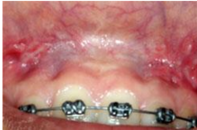
Fig. 3 - Imágenes clínicas de posoperatorio luego de cuatro meses.