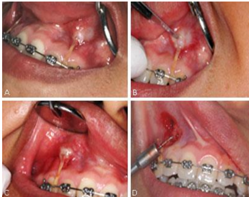
Fig. 1 - Evaluación clínica de la paciente. A, B - Mucosa oral con signos de inflamación asociada a dispositivos de anclaje temporal | C, D - Remoción quirúrgica de los minitornillos de ortodoncia.

Se diagnosticó mucositis periimplantaria, descartando la periimplantitis, ya que no se encontró lesión en tejidos duros. Como tratamiento, se realizó la remoción quirúrgica de minitornillos de ortodoncia (Fig. 1C, D). El tratamiento se realizó con previo consentimiento del paciente, quien dejó plasmada su disposición mediante el consentimiento informado para este tratamiento y el posterior estudio histopatológico.