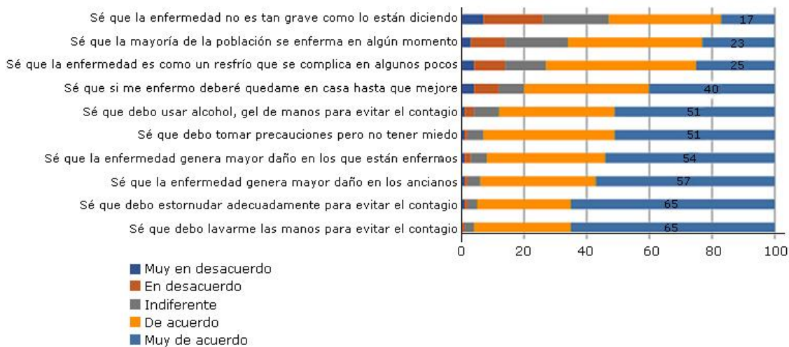
Fig. 1 - Porcentajes de nivel de acuerdo con cada una de las diez preguntas del encuestado empoderado en el tema de coronavirus en Perú.

Cuando se cruzaron la sumatoria de puntos del paciente empoderado versus el nivel educativo, se encontró que casi todas las medianas estaban en 42 puntos, excepto la de los que tenían nivel técnico, que tenía un punto menos (Fig.2).