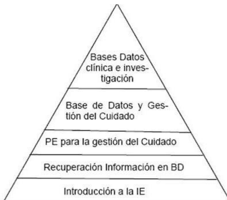
Figura 1. Orden ascendente de los cursos de gestión e IE.