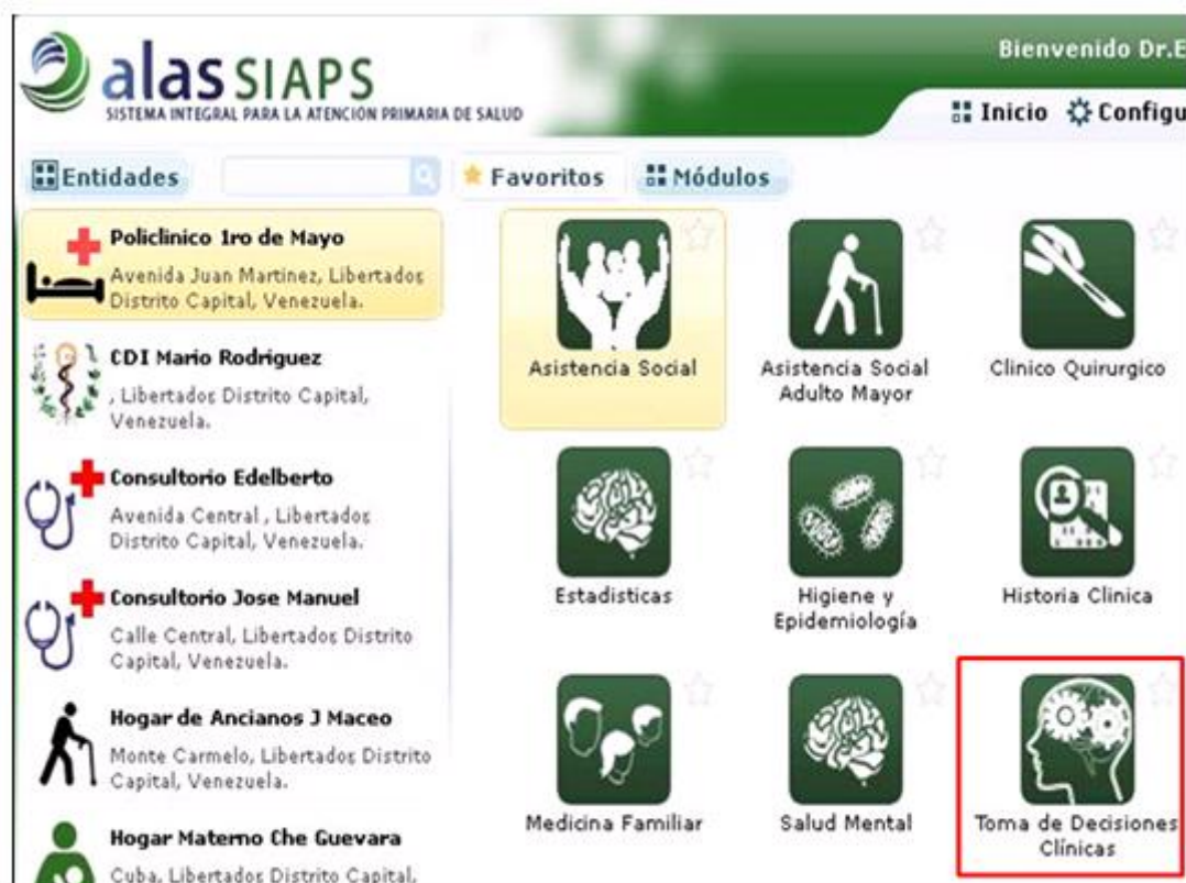
Fig. 2. Herramienta incluida en el sistema alas SIAPS

Como un módulo del Sistema Integral para la Atención Primaria de Salud (alas SIAPS) se construye la herramienta propuesta, aunque también puede ser incorporada al Sistema de Gestión Hospitalaria (alas HIS) como muestra en la figura 2.