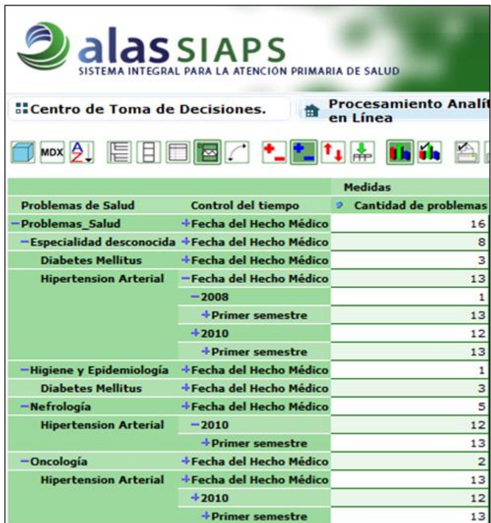
Fig. 5. Comportamiento de la HTA, según el historial de los datos de las HCE

Se precia además como el hábito de fumar, así como el consumo de sal tienen una gran influencia en los pacientes consultados (Fig. 6).