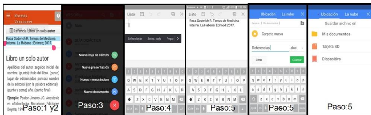
Fig. 3.- Secuencia para la recuperación de la cita bibliográfica una vez generada.