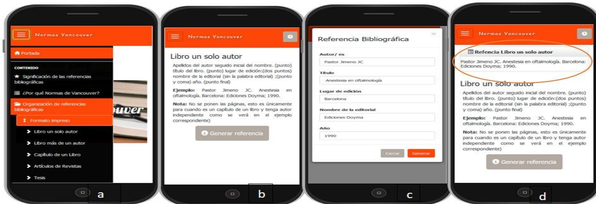
Fig. 2- Menú: a) Organización de referencias bibliográficas, formato impreso. b) libro un solo autor, c) formulario de referencia d) referencia generada.

En la Figura 2 se muestra la secuencia en cuatros pasos para la organización de referencias bibliográficas en formato impreso; de igual modo se puede hacer en el formato electrónico.