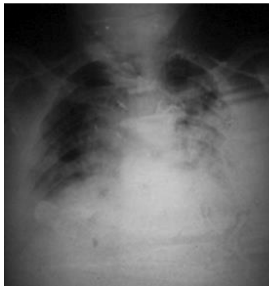
Fig. 1 - Rayos X tórax anteroposterior previo a la ventilación.

Se trasladó al Servicio de Terapia Intensiva. En la tarde del día siguiente fue necesaria la intubación para ventilación mecánica artificial. En la figura 1 se aprecia la opacidad de la mitad inferior de ambos hemitórax. El hemitórax derecho tenía un aspecto heterogéneo y el izquierdo en masa. Además, había ensanchamiento mediastinal de aspecto vascular e infiltrado intersticial bilateral parahiliar.