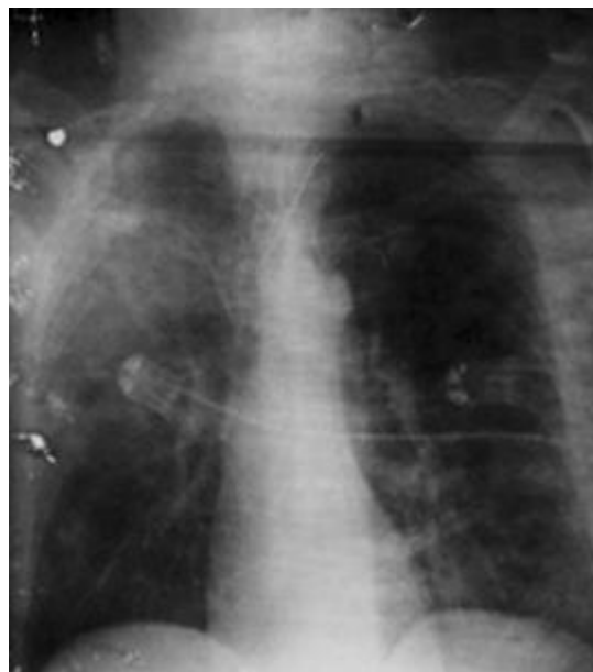
Fig. 4 - Rayos X de tórax anteroposterior, 48 horas después del procedimiento.

Se le realizó Rx evolutivo, donde se observó mejoría de las lesiones descritas anteriormente, aunque se mantuvieron ligeras lesiones inflamatorias parahiliares (Fig. 4).