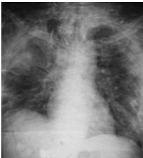
Fig. 3 - Rayos X de tórax anteroposterior previo a la ventilación.

Se decidió intubación orotraqueal para ventilación mecánica artificial. Se acopló a ventilador Bella Vista, en la modalidad de APRV, con los parámetros referidos en la tabla 2, y con los mismos objetivos que en el caso anterior.