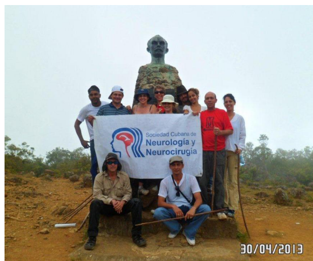
Figura 3. Homenaje de la SCNN al Maestro en el 160 aniversario de su natalicio.

Key words. Cuba. Neurology. Neurosurgery. History of medicine.