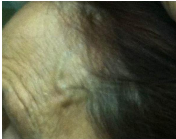
Figura 1. Engrosamiento de la rama frontal y parietal de la arteria temporal izquierda.

evidente en la izquierda) ( Figura 1 ), dolor a la palpación y la ausencia de los pulsos de las arterias temporales, mialgia y rigidez cervical, claudicación mandibular y paresia del músculo recto externo izquierdo. La determinación de la velocidad de sedimentación globular fue de 76 mm/h.