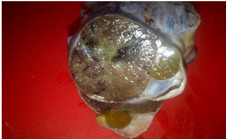
Fig. 1. Aspecto macroscópico de struma ovarii, obsérvese el componente predominantemente sólido con tendencia a la multinodularidad, áreas de hemorragia y ausencia de necrosis.

Macroscópicamente en los teratomas se encontró componente quístico en 118 casos (28,7 %) y en 6 casos (1,4 %) predominó un patrón macroscópico sólido, de este último grupo, 4 casos (0,9 %) correspondían a S.O. (Fig. 1).