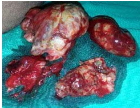
Fig. 1. Varios fragmentos del tumor extraídos de vagina.

Previo consentimiento con los padres, y con acompañamiento de Psicología se decide realizar exploración de la vagina bajo anestesia, durante la misma se observa en esta una tumoración que ocluía por completo las paredes de la vagina, se procede a extraer la masa tumoral, extirpando varios fragmentos del tumor el mayor de aproximadamente 6 centímetros (Fig. 1). Posteriormente se envían al departamento de Anatomía Patológica recibiendo como diagnóstico histológico rabdomiosarcoma botrioides de la vagina (Fig. 2).