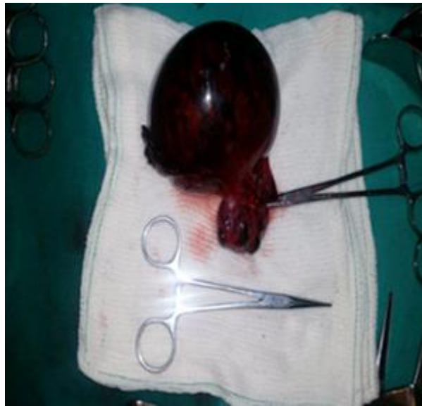
Fig. 1 - Pieza obtenida que muestra masa de tejido de 11x10 x 7 cm de color violáceo, acompañada de ovario, de aspecto hemorrágico.

Teniendo en cuenta las características isquémicas del anejo y los días de evolución, se realizó salpingo ooforectomía derecha. Se observaron útero, trompa de Falopio y ovario izquierdo sin alteraciones. La paciente tuvo una evolución postoperatoria favorable. Se decidió alta del servicio y seguimiento en consulta de Ginecología.