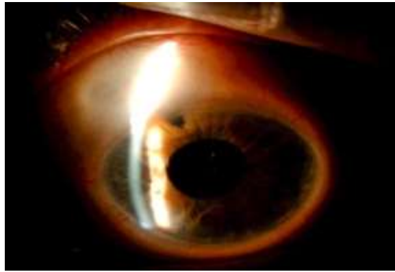
Fig. 3 - En la imagen posquirúrgica se visualiza ampolla de filtración y XEN en la cámara anterior.