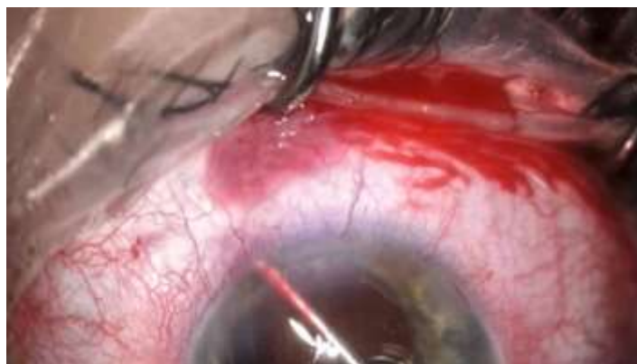
Fig. 2 - Implante XEN intraoperatorio.