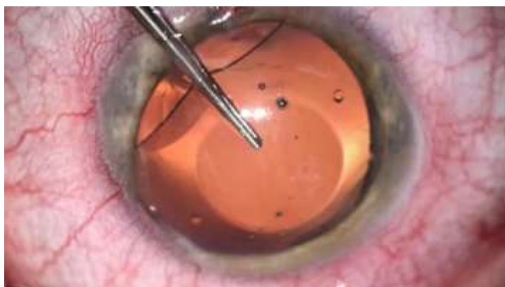
Fig. 1 - Retirada intraoperatoria de lente ICL.