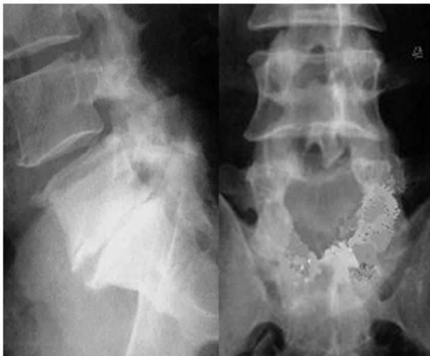
Fig. 1. Radiografías que muestran la liberación simple en estenosis L5-S1.