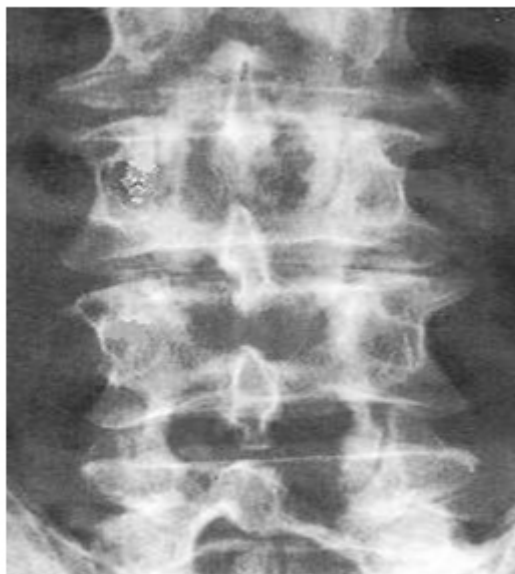
Fig. 2. Radiografía de recalibraje L2, L3, L4 y L5.