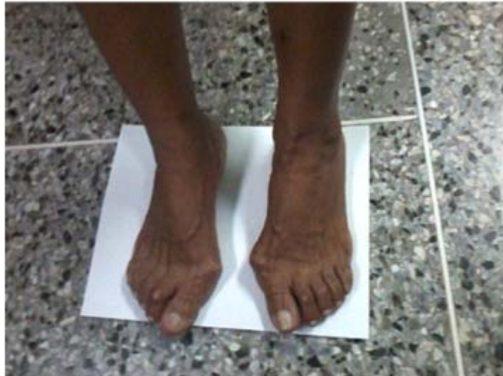
Fig. 1. Paciente femenina, 68 años de edad con gran deformidad en ambas articulaciones metatarso-falángica del hallux.

Se realizó un estudio descriptivo longitudinal de los pacientes operados de hallux valgus en los Centro Médico Diagnóstico Integral con Quirófano "Dr. Alfonso Grieco Sabalo" y "José Natalio Estrada" de los municipios José Antonio Páez y San Fernando de Apure respectivamente, Estado Apure, República Bolivariana de Venezuela, entre Marzo de 2009 y Febrero de 2012 (36 meses). Se realizó la técnica de osteotomía proximal del primer metatarsiano y liberación distal de las partes blandas. 15 Los criterios de inclusión fueron adultos mayores de 18 años de edad con diagnóstico de hallux valgus moderado (ángulo HV entre 20° - 40° y ángulo intermetatarsiano 1ro. y 2do. menor de 16°) y hallux valgus severo (ángulo HV > 41° y ángulo intermetatarsiano mayor de 17°) según clasificaron Mann y Coughlin , 15 que presentaban dolor, molestias en el calzado y afectación en sus actividades diarias y de recreación (Figs. 1 y 2). Los pacientes aceptaron se le realizará la operación a través del documento del consentimiento informado. Todos los casos fueron evaluados y operados por el mismo cirujano. Se excluyeron del estudio 4 pacientes que no acudieron a las consultas posteriores.