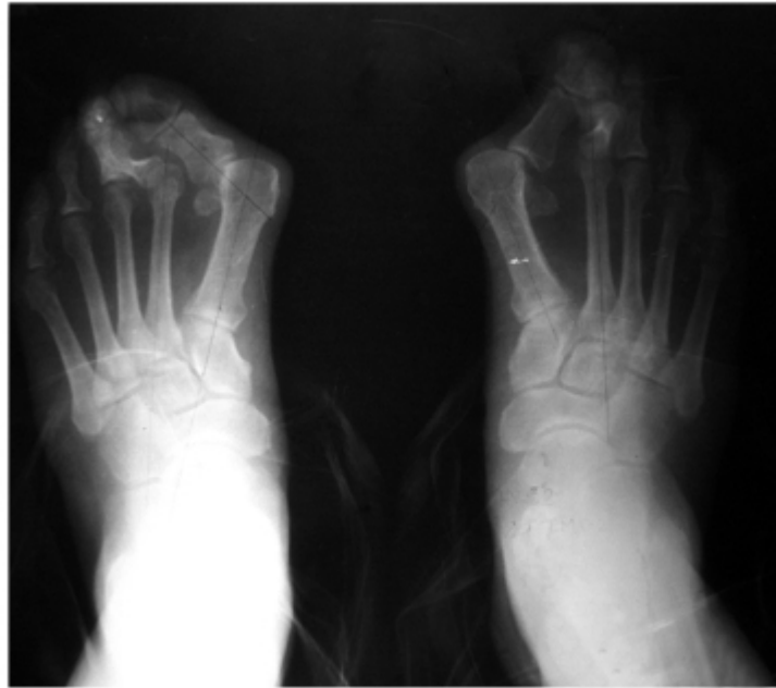
Fig. 2. Radiografía AP con carga de peso en un paciente masculino de 67 años con hallux valgus severo con subluxación.

La muestra quedó constituida por 16 pacientes (30 pies), de ellos 11 mujeres y 5 hombres. El promedio de edad fue de 44 años (rango 29 y 75 años). De ellos 11 del sexo femenino y 5 masculino. Del total, 14 pacientes presentaron HV bilateral y se operaron en momentos diferentes con tres meses como mínimo entre un pie y el otro, y en dos pacientes fue unilateral, siendo el pie derecho en ambos casos.