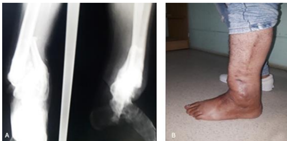
Fig. 5 - A. Radiografía de control. B. Fotografía a los 2 años de operado.

Se le realizaron radiografías de control y fotografía a los dos años de su seguimiento en las que se observa el excelente resultado final (Fig. 5-A-B).