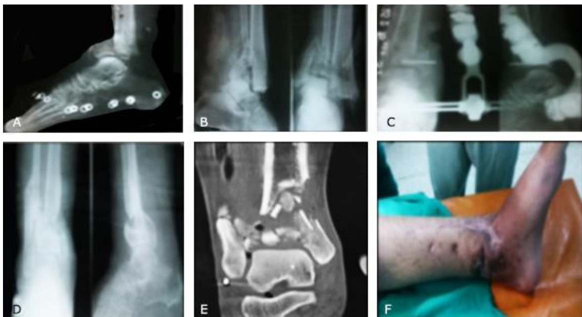
Fig. 1 - A. Radiografía inicial de urgencia, con el zapato. B. Control preoperatorio. C. El primer fijador que le colocaron. D. Radiografía con pseudoartrosis e imagen antes del tratamiento quirúrgico. E. Corte de la TAC. F. Fotografía antes del tratamiento quirúrgico (ver cicatrices).

A los ocho meses comienza con dolor, que no cedía a los analgésicos, claudicación a la marcha, lesión crónica de la piel y deformidad en varo por la inestabilidad articular del tobillo debido a la pseudoartrosis. Se le realizan radiografías y TAC (Fig. 1-D y E).