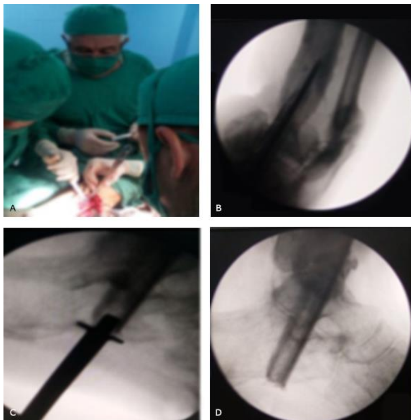
Fig. 2 - A. Durante el acto quirúrgico tomando 10 cm el peroné. B. Radiografías de control en el salón, AP y lateral, mostrando el Staiman guía. C. Impactando el injerto de peroné. D. Colocado.

Colocación del fijador externo: con transfixor eléctrico y de baja velocidad o revoluciones, para no producir efectos térmicos en la piel ni en el hueso, se colocan los Staiman del modelo RALCA®, a nivel de la tibia y el calcáneo con barras en T, para luego realizar compresión a nivel de la articulación (Fig. 3-A). Se cura al paciente y se le cambia el vendaje al día siguiente (Fig. 3-B).