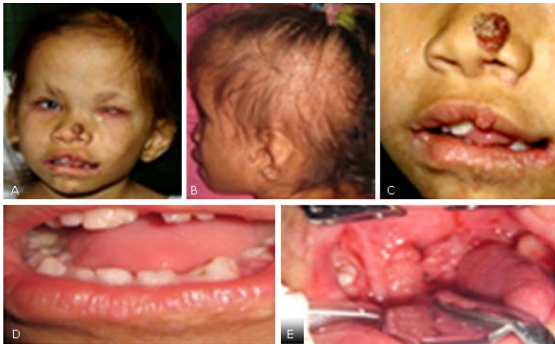
Fig. 1 - A. Microcefalia, facies asimétrica, estrabismo y cataratas del ojo derecho con ceguera total del ojo izquierdo. B. Cabello escaso y quebradizo, orejas hipoplásicas con implantación baja. C. Papilomatosis nasal y pericomisural con macrostomía izquierda. D. Microdoncia, oligodoncia, fusión dentaria e hipoplasia del esmalte. E. Amígdalas hipertróficas con múltiples lesiones papilomatosas.

Alteraciones bucodentales. Microdoncia, oligodoncia, fusión dentaria e hipoplasia del esmalte. Amígdalas hipertróficas con múltiples lesiones papilomatosas (Fig. 1).