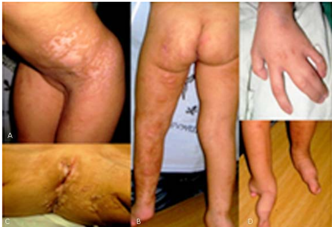
Fig. 2 – A. Manchas hiperpigmentadas e hipocrómicas siguiendo las líneas de Blaschko. B. Cara posterior del miembro inferior izquierdo presencia de masas abollonadas, rosadas, blandas, combinadas con lesiones acrómicas y atróficas. C. Región perianal (papilomas) D. Sindactilia.

Lesiones esqueléticas. Sindactilia cutánea en la mano izquierda entre los dedos III y IV y sindactilia bilateral de pies; presencia de estrías longitudinales en los huesos largos y escoliosis tóracolumbar (Fig. 2).