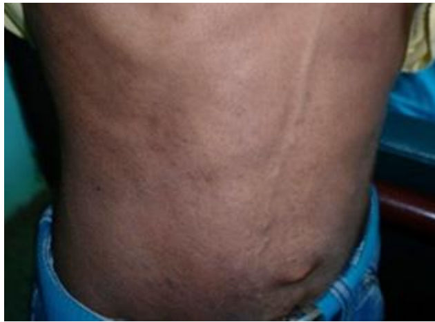
Fig. 2 - Lesiones maculares hiperpigmentadas con grados variables de atrofia (madre).

Por lo anterior, se decide realizar biopsia a lesiones cutáneas de lactante que informa dermatitis liquenoide de predominio linfocítico con degeneración vacuolar de la capa basal e incontinencia pigmentaria, además de cambios epidérmicos que alternan grados variables de atrofia epidérmica con regiones de papilomatosis, estas últimas compatibles con la fase verrucosa de la enfermedad (Fig. 3).