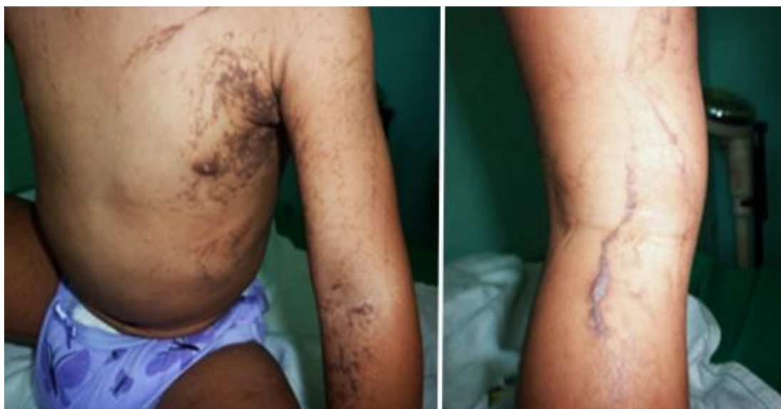
Fig. 1 - Lesiones vegetantes y maculas hiperpigmentadas color café, que siguen las líneas de Blaschko (hija).

Al examen físico materno se detecta la presencia de lesiones hiperpigmentadas con grados variables de atrofia cutánea de disposición lineal y en espiral localizadas en tronco y extremidades, además de dientes cónicos (Fig. 2).