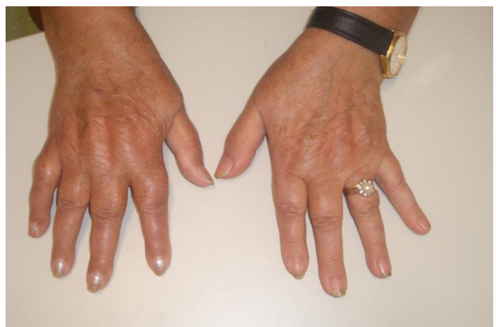
Figura 2 Poliartritis simétrica en metacarpofalángicas de ambas mano similar a la artritis reumatoide

Presentamos el caso de una paciente de sexo femenino, con una infección parasitaria que induce un cuadro de poliartritis simulando una artritis reumatoide. Lo relevante de este caso es la infrecuente asociación de este agente etiológico en afecciones osteoarticulares, permitiéndonos hacer una revisión bibliográfica y reportar esta asociación clínica como una de las pocas en nuestro medio.