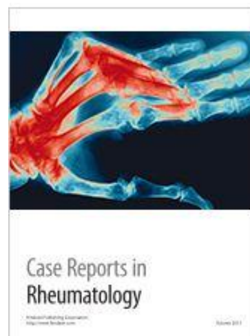
Figura 1. Carátula de la revista digital Case Reports in Rheumatology 1

Teniendo en cuenta que se trata de artículos concisos, no debe emplearse este espacio en incorporar datos que no resulten relevantes o distraigan la atención del objetivo central, pero si se deben enriquecer con imágenes demostrativas de una enfermedad, o de resultados de estudios complementarios siempre que existan, lo cual le brinda relevancia a los mismos.