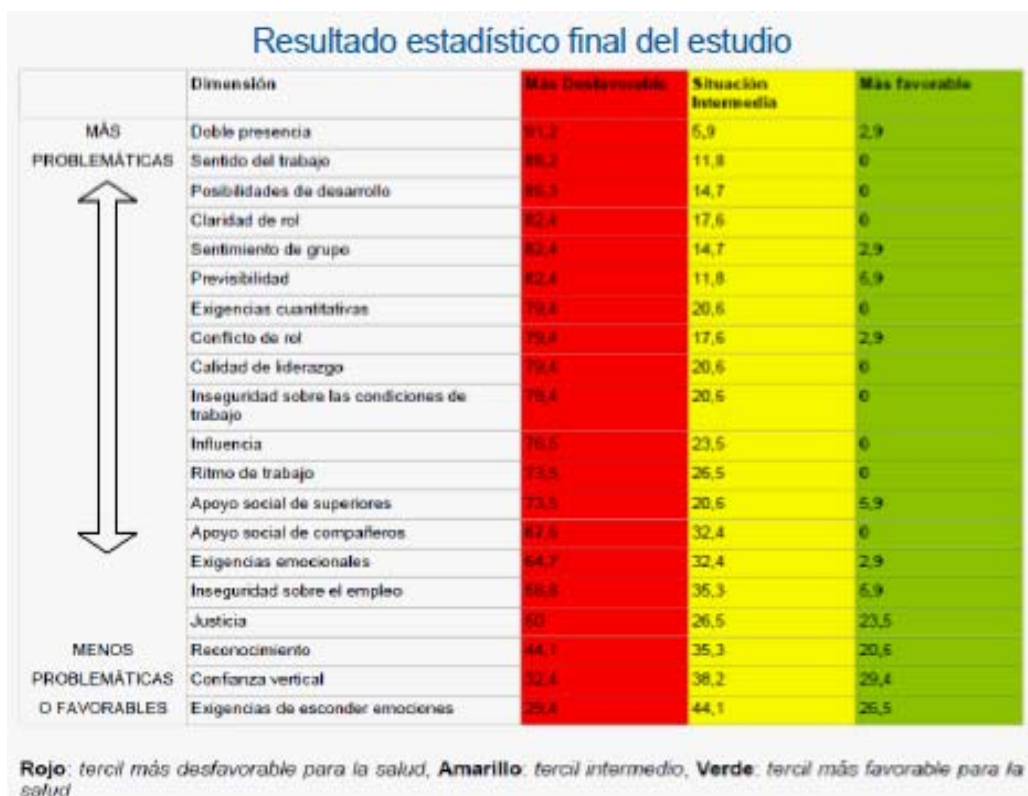
Figura 2 Prevalencia de exposición