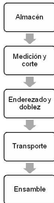
Diagrama de flujo del proceso de trabajo de armado del emparrillado Obra de construcción, ciudad de México, 2017