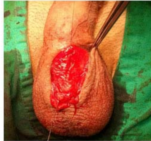
Foto no. 7 Rafia simple paredes diverticulo