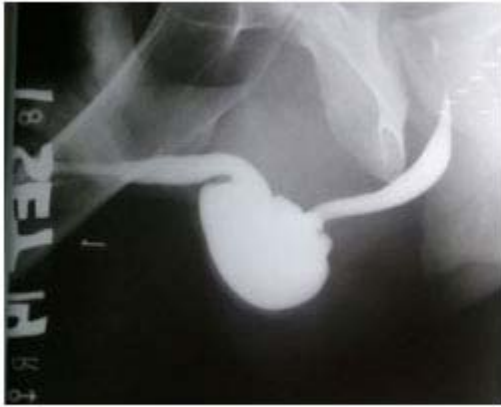
Foto No.2 Uretrografia retrograda (UR)