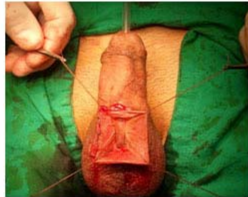
Foto No. 5 Divertículo abierto