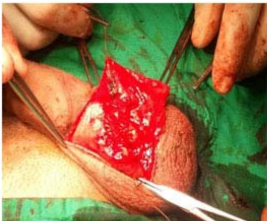
Foto no. 8 Refuerzo con capa de Dartos