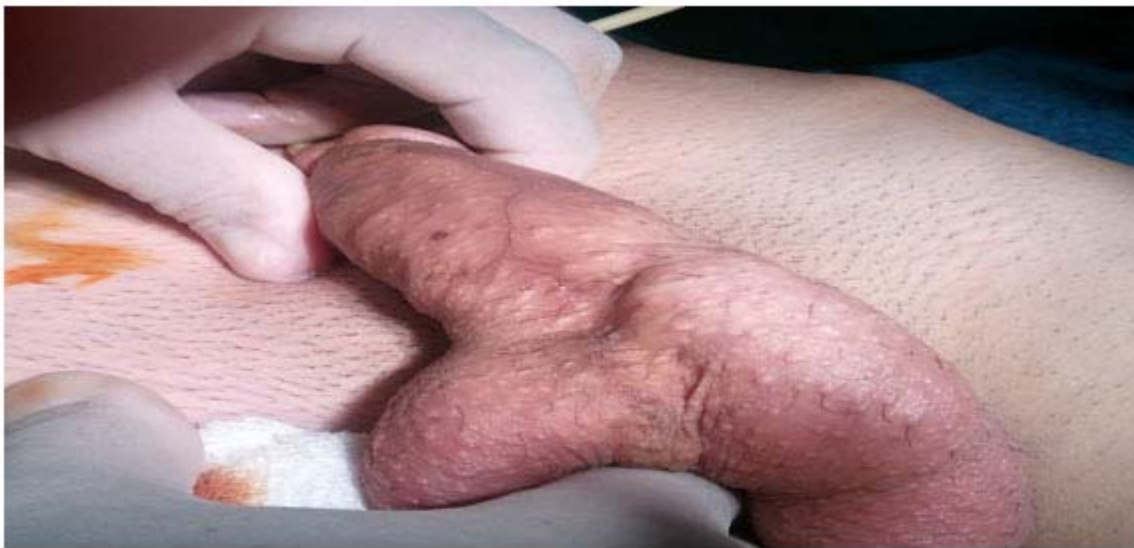
Foto No 1. Dilatación hidráulica de la uretra para mostrar el divertículo