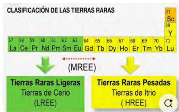
Imagen de dominio público.

La creatividad del hombre ha escalado desde la época en que se cubrió la piel hasta ésta, la del hombre híbrido, domesticado por las herramientas.