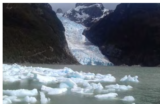
Glaciar en el Parque Torres del Paine, en la Patagonia Chilena.

En el cosmos, el asteroide 2024YR0 sigue una ruta impredecible, como factor contingente e indiferente, recordándonos que hay sucesos naturales no elegibles; aun así, podemos afrontar, tal vez solo unos cuantos, desde el estilo de vivir, rezando, calculando y volviendo a calcular; o contribuir con ideas tanto de individuos como grupos a los países que ya empiezan a bosquejar estrategias, cada uno desde lo que hace.